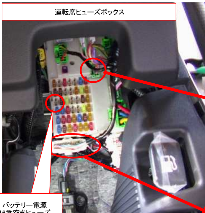
バッテリー電源 16番空きヒューズ