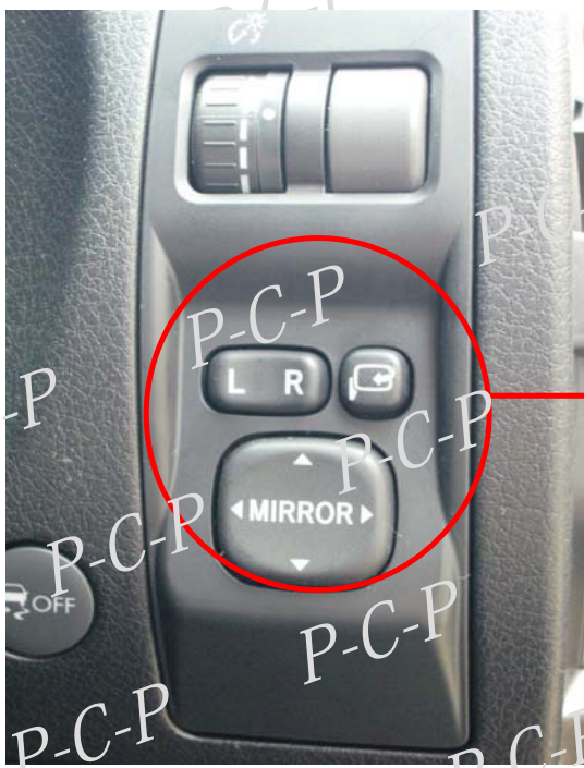
ドアミラースイッチコネクタ