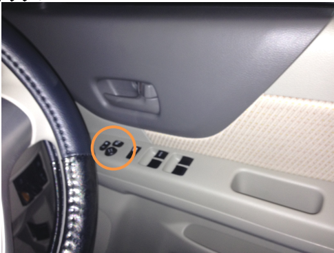
ミラースイッチ裏