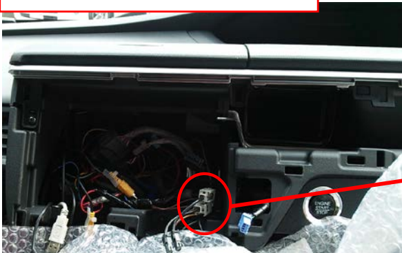
コネクタ3 (オーディオナビ裏ハーネス)