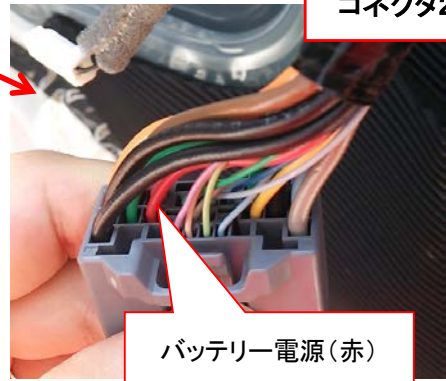
バッテリー電源(赤)