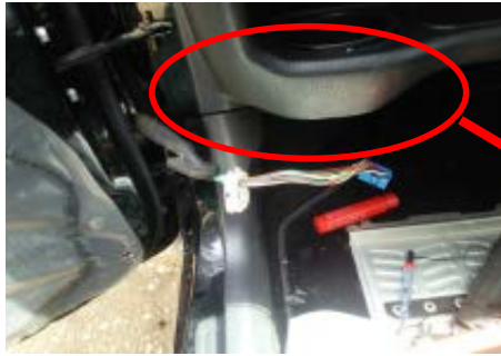
助手席の足元付近にあるドアからのコネクタを外す *ドリンクホルダカバーとグローブBOXを外すとやりやすい