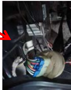
コネクタ1 助手席足元付近