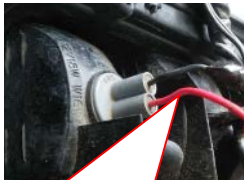
リバース時ポジション信号線 (赤)