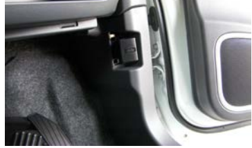
配線束 (運転席足元)