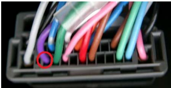
コネクタ1 ナビ裏コネクタ