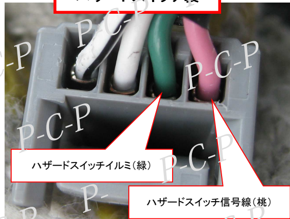
コネクタ2 ハザードスイッチ裏