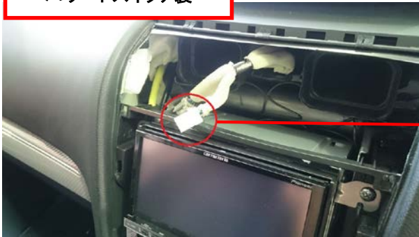
コネクタ1 ハザードスイッチ裏