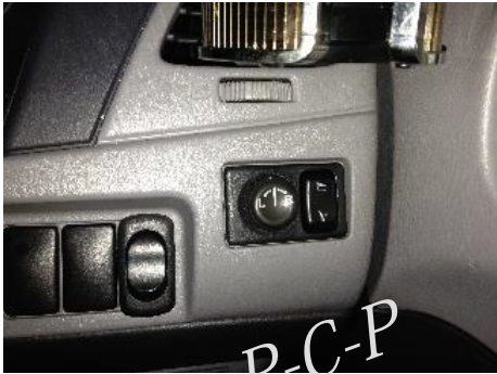
コネクタ1(ミラースイッチ裏)