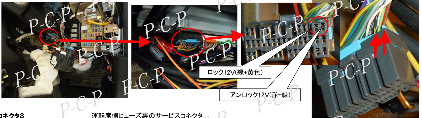
コネクタ3 運転席側ヒューズ裏のサービスコネクタ