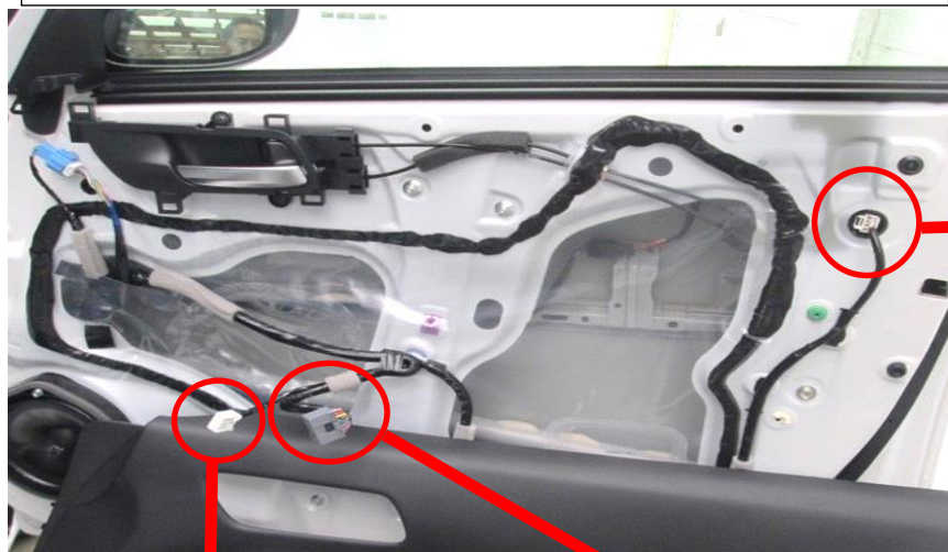
コネクタ 2 運転席ドア内部 (後ろ側)