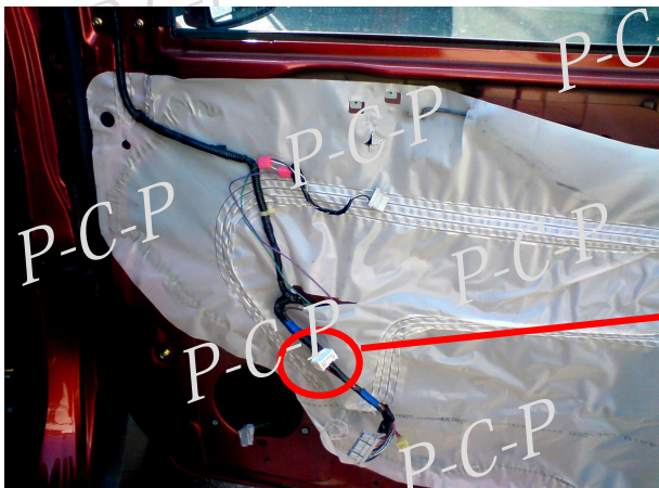
コネクタ1 運転席ドア内部

※装置タイプEには紫色配線、タイプDには橙色配線、タイプCには橙色及び紫色配線はございません。