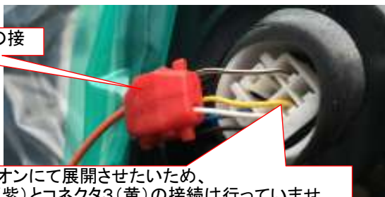
ACCオンにて展開させたいため、 装置(紫)とコネクタ3(黄)の接続は行っていま せん