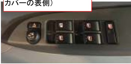
コネクタ1 (運転席ドアミラースイッ チカバーの裏側)