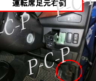
コネクタ2 運転席足元右側