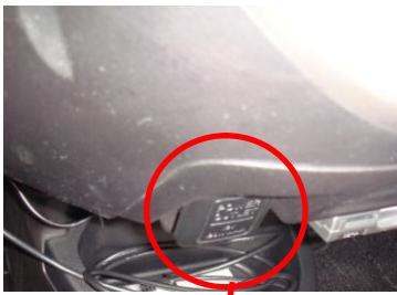
コネクタ1 センターパネル裏 シガーライタコネクタ

注1: 本体と専用リレーを同時注文いただいた場合、本体と専用リレーは結線された状態となっています。