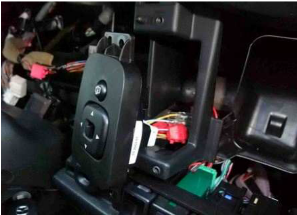
コネクタ1(ミラーコントロールスイッチ裏側)

※1: 本体とARL-03を同時注文いただいた場合、本体とARL-03は結線された状態となっています。