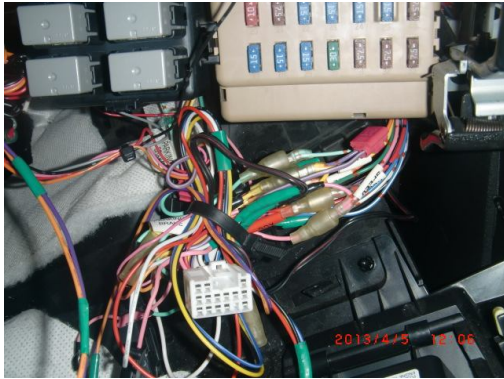
コネクタ1 ヒューズBOXの裏あたりの15Pのコネクター