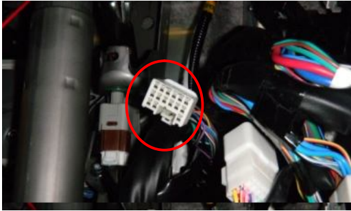
コネクタ1の情報(運転席足元奥)