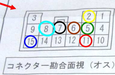
コネクタ1勘合面視 (オス)