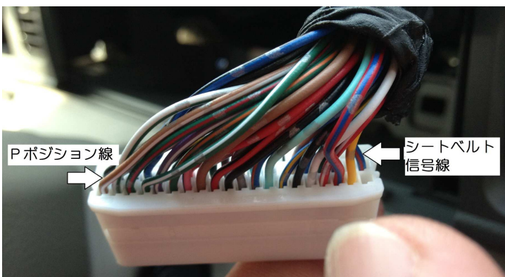
メーター裏にある40P