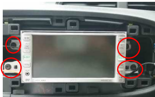
センサー取付位置