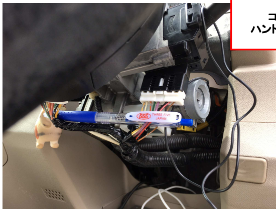
コネクタ1 ハンドルコラム内