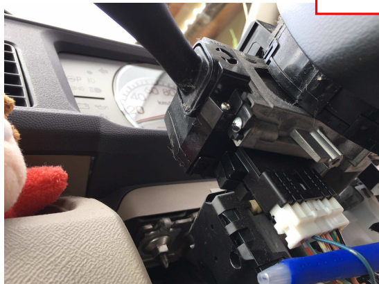
コネクタ2 ハンドルコラム内