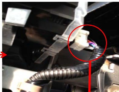
スモールライトスイッチ信号(灰)