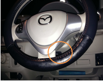
ハンドル裏コラムカバー内右下