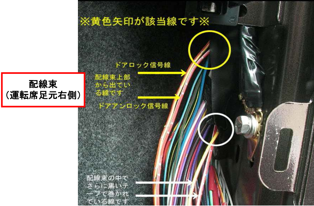
配線束 (運転席足元右側)

配線束の中から〔黄/赤/銀斑点〕（ドアロック信号線）〔赤/白/銀斑点〕（ドアアンロック信号線）色の線を探します。同色の線は各4本づつ有ります。太い線2本・細い線2本です。細い線は除外します。太い線の内各1本づつは配線束上部から出ています（黄丸）。残りの1本づつは配線束の内部でさらに黒いテープで巻かれています。写真では判りづらいですが（白丸）の辺りから出ています。配線束上部から出ている線（黄色一）が使用する該当線です。